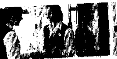
klassische Hotellerie und perfekter Service.